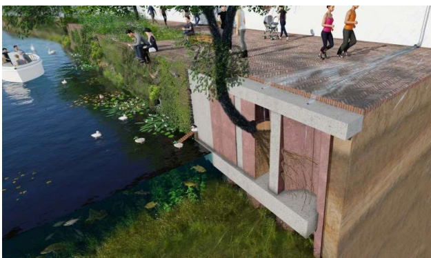
Groene kademuren in Breda en Den Haag