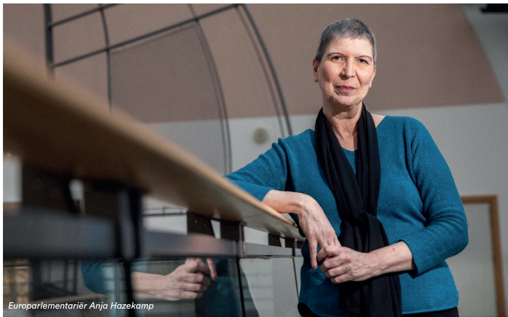
Europarlementariër Anja Hazekamp

Het Europees Parlement stemde in met verplichte chip- en registratie voor honden en katten in de EU . Hierdoor is beter bij te houden waar dieren vandaan komen en wordt illegale handel moeilijker. De nieuwe regels stellen ook duidelijke eisen aan het welzijn van dieren en pakken misstanden aan.