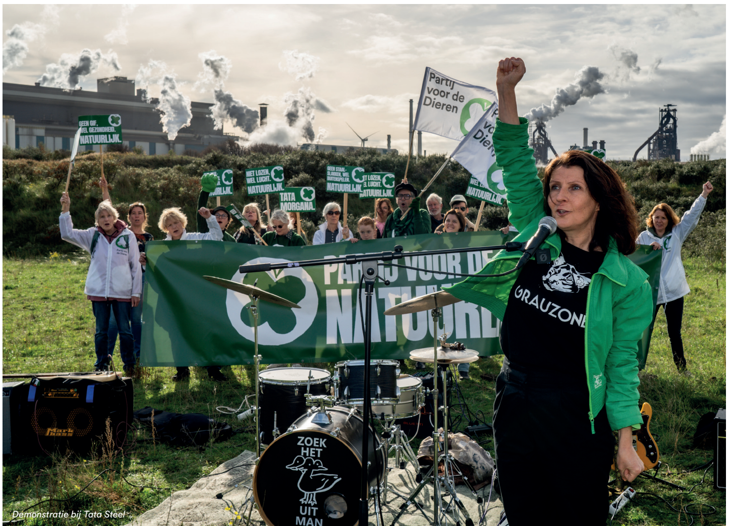
Demonstratie bij Tata Steel

Solidair met Palestina. We waren dit jaar naast 18 mei en 15 juni (lees hierover meer in acties en evenementen) ook aanwezig bij de grootste rode lijn demonstratie op 5 oktober. Deze demonstratie had grote maatschappelijke impact dit jaar. We gingen dit keer met 250.000 mensen in rode kleding de straat op. Met een duidelijke boodschap: stop de genocide in Gaza nu! Onze Kamerleden en vele lokale afdelingen waren bij deze demonstratie aanwezig. Het was enorm indrukwekkend.