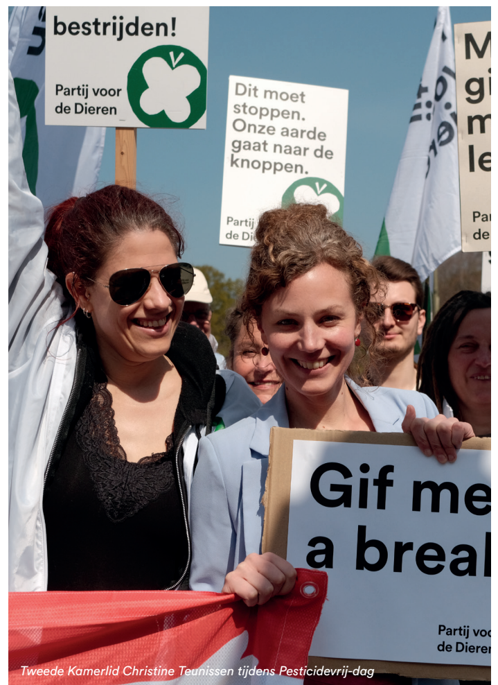
Tweede Kamerlid Christine Teunissen tijdens Pesticidevrij-dag

We strijden voor strengere (Europese) regels die landbouwmiddelen verbieden en voor het herstellen van onze ecosystemen. Daarnaast moeten we omwonenden beschermen. Wij steunen een landbouw die werkt met de natuur, in plaats van ertegenin.