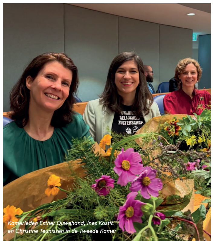
Kamerleden Esther Ouwehand, Ines Kostić en Christine Teunissen in de Tweede Kamer

We hebben een nieuw wetsvoorstel ingediend om een einde te maken aan de bio-industrie . Het voorstel is op 4 oktober naar de Tweede Kamer gestuurd. Het vraagt om een einde aan het structurele lijden van dieren in de intensieve veehouderij.