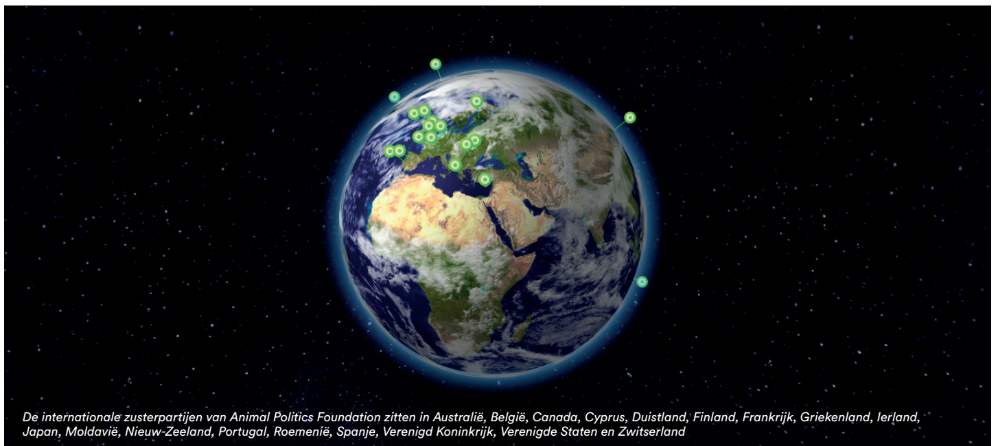
De internationale zusterpartijen van Animal Politics Foundation zitten in Australië, België, Canada, Cyprus, Duistland, Finland, Frankrijk, Griekenland, Ierland, Japan, Moldavië, Nieuw-Zeeland, Portugal, Roemenië, Spanje, Verenigd Koninkrijk, Verenigde Staten en Zwitserland