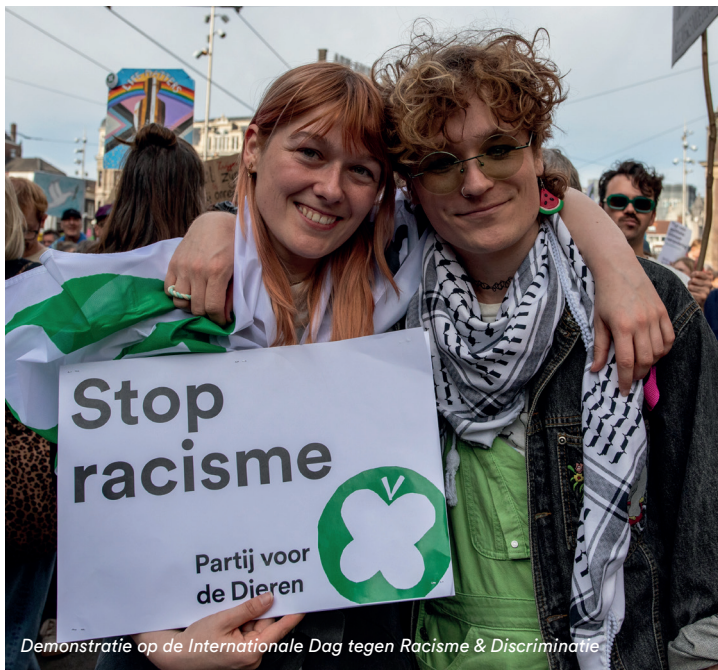
Demonstratie op de Internationale Dag tegen Racisme & Discriminatie

Het is hard nodig om met zoveel mensen dit geluid te laten horen in een tijd waarin in veel landen een radicaalrechtse wind waait. Er vinden nog altijd verschrikkelijke oorlogsmisdaden plaats in Gaza, mensen met een migratieachtergrond worden gebruikt voor zondebokpolitiek en ook de Nederlandse rechtsstaat staat onder druk. We blijven vechten voor alles wat ons dierbaar is.