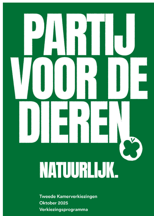
Het verkiezingsprogramma 'Partij voor de Dieren. Natuurlijk.'