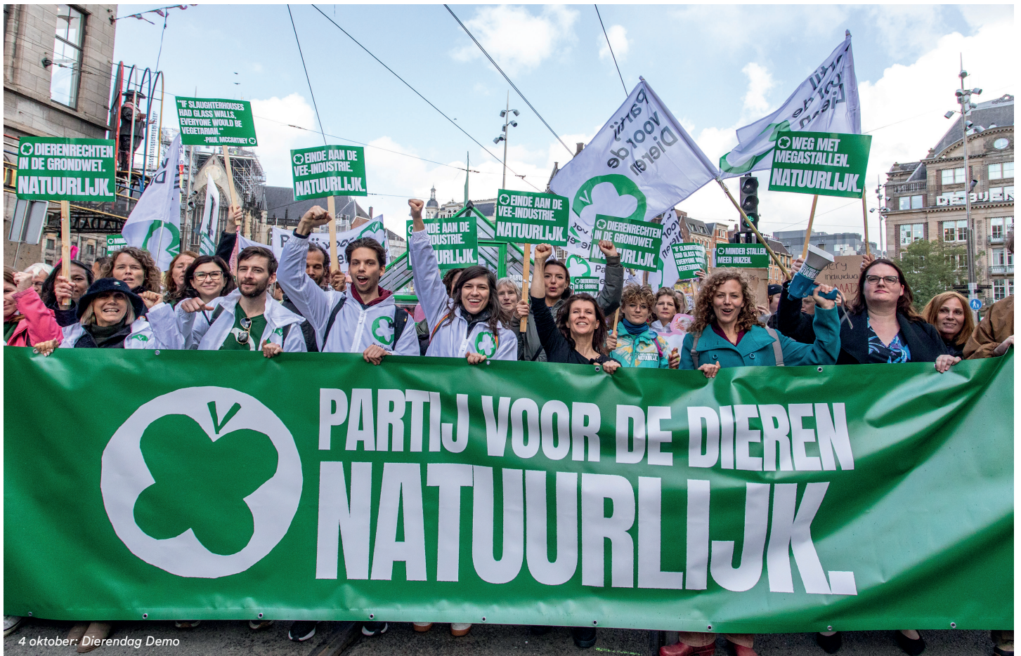
4 oktober: Dierendag Demo