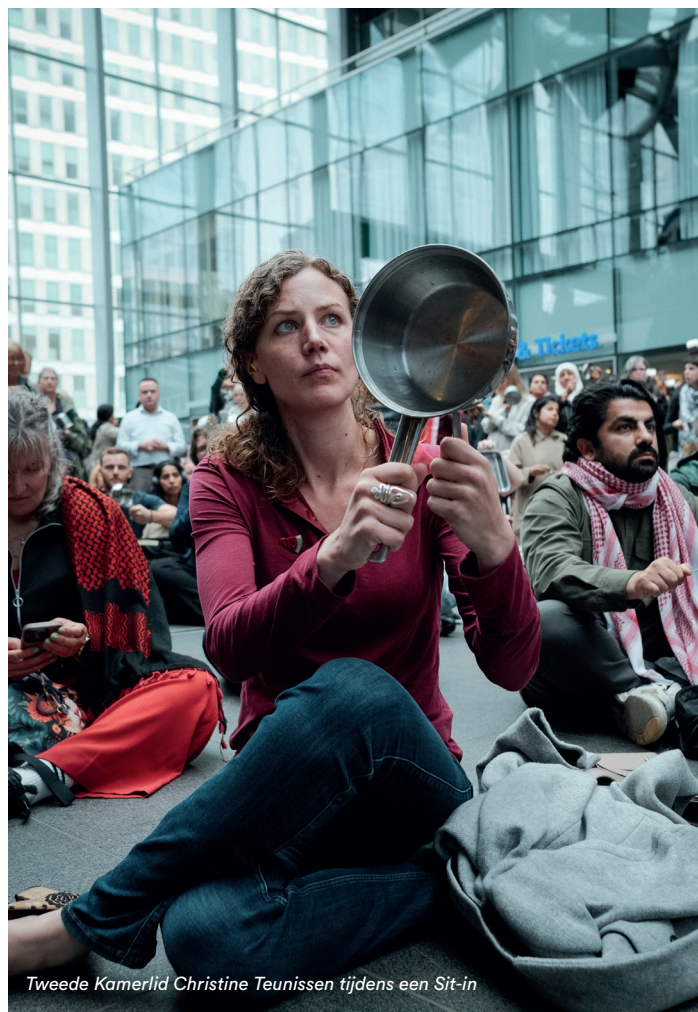
Tweede Kamerlid Christine Teunissen tijdens een Sit-in