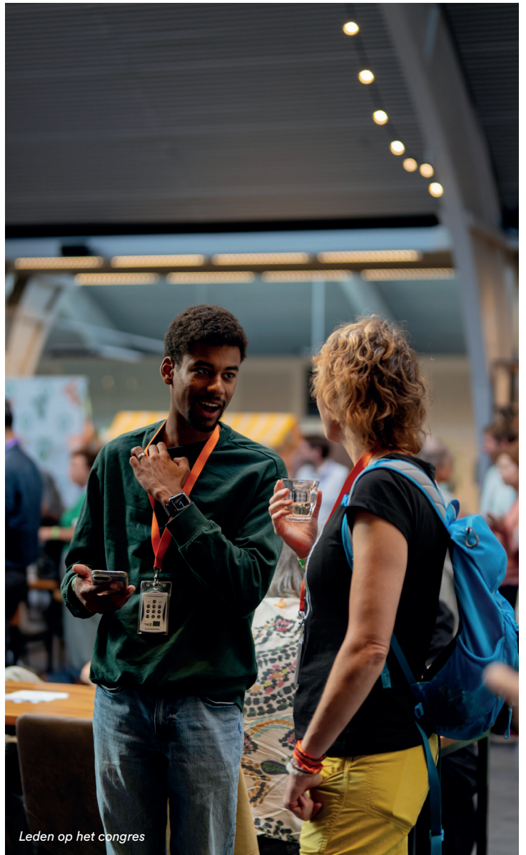
Leden op het congres