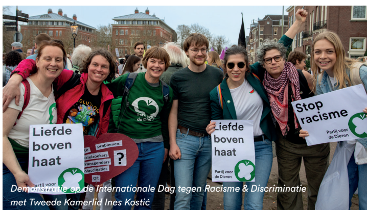
Demonstratie op de Internationale Dag tegen Racisme & Discriminatie met Tweede Kamerlid Ines Kostić