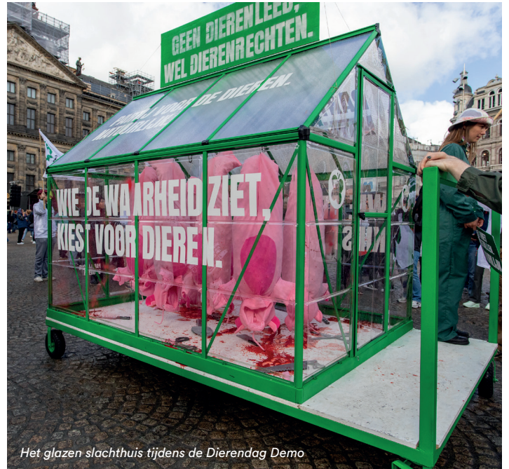
Het glazen slachthuis tijdens de Dierendag Demo

Dit glazen slachthuis is een mooi symbool dat de aandacht trekt. Dit gebeurde ook volop in de media. Toch moet het hier niet bij blijven en zijn er echte politieke maatregelen nodig voor de afbouw van de vee-industrie. Daarom dienden we op dezelfde dag een wet in om definitief een einde te maken aan deze industrie.