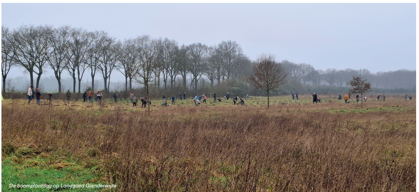
De boomplantdag op Landgoed Gienderwijte

Daarnaast houdt het partijbureau zich bezig met ledenservice, ledenwerving en ledenadministratie. De jaarlijkse contributie van onze leden is van groot belang voor veel van de activiteiten van de partij: hoe meer leden, hoe meer we kunnen doen.