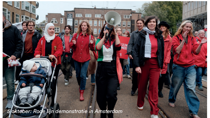
5 oktober: Rode Lijn demonstratie in Amsterdam

Minder Tata Steel betekent meer gezondheid, meer schone lucht, meer klimaat en meer biodiversiteit.