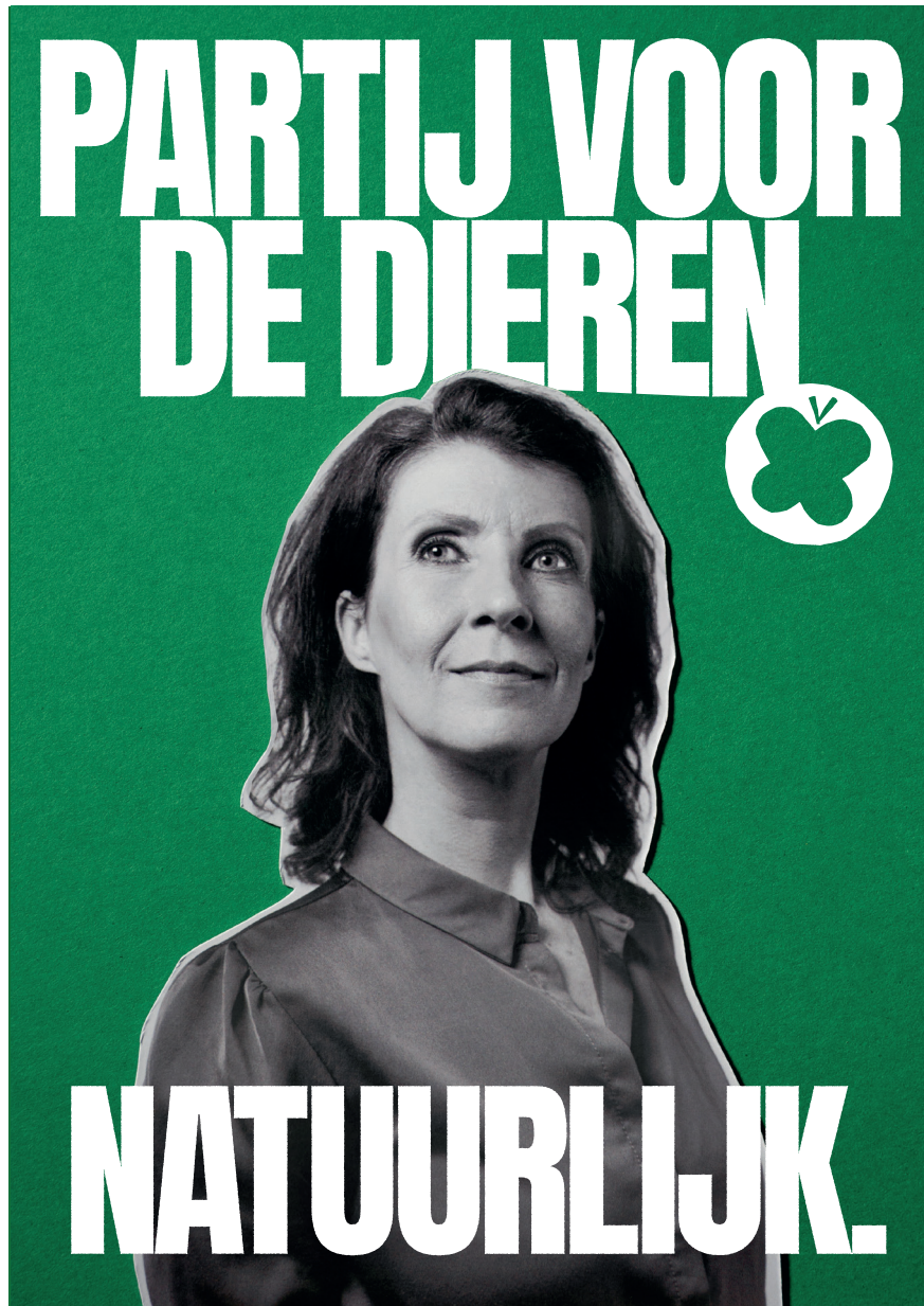
Poster Tweede Kamerverkiezingen

Leden kregen net als andere jaren een campagnepakket met poster en flyers opgestuurd. Nieuw dit jaar waren de stickers.