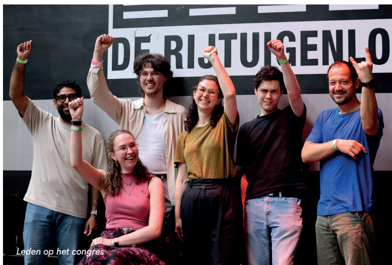
Leden op het congres

Op het congres werd uitgebreid gesproken over defensie. Leden kregen de ruimte om hun mening te geven. Het was een discussiepunt, maar uiteindelijk zijn meerdere voorstellen aangenomen. En sprak een meerderheid steun uit voor de lijn van de Tweede Kamerfractie. Daarna is er een participatietraject gestart, waarin leden verder in gesprek konden gaan over het partijstandpunt op defensie. Dat traject is versneld en werd nog voor de verkiezingen afgerond. Daarnaast werd teruggeblikt op behaalde successen en de groei van de partij tot ruim 32.000 leden, en werkten de leden aan het verkiezingsprogramma voor de gemeenteraadsverkiezingen van 2026.