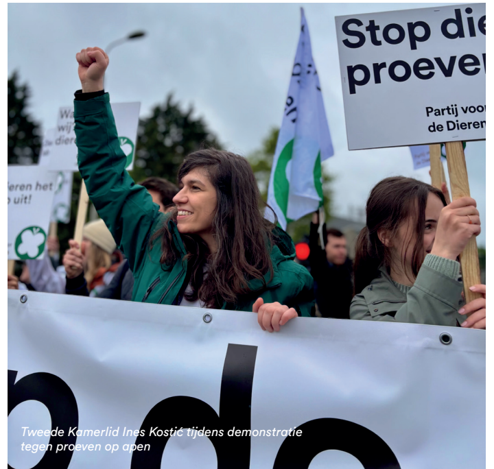
Tweede Kamerlid Ines Kostić tijdens demonstratie tegen proeven op apen

Onze motie, later in het jaar ingediend om apenproeven nu echt zo snel mogelijk af te bouwen, is gelukkig aangenomen.