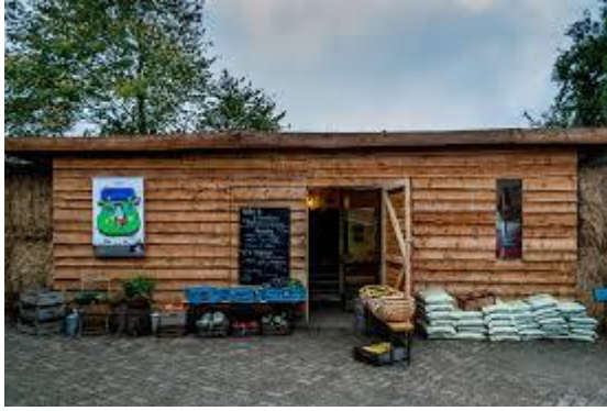
Weilandwinkel Hoeve Biesland