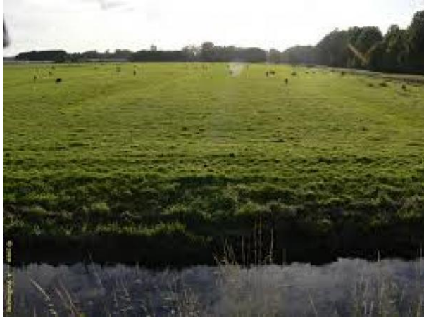
Zuidpolder Pijnacker/Delfgauw/Oude Leede