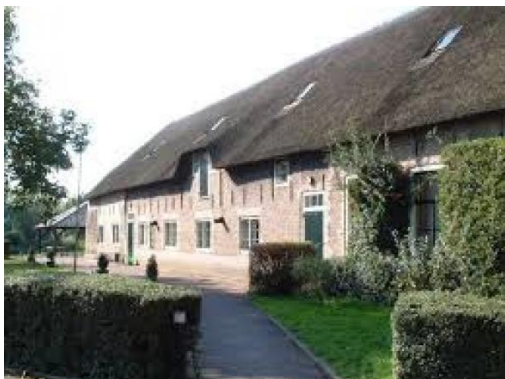
Jeugdcentrum De Notelaer, Pijnacker

De Partij voor de Dieren heeft grote moeite met het voorstel om veel maatschappelijk vastgoed af te stoten. Grondwettelijk is vastgelegd dat de overheid voorwaarden moet scheppen voor maatschappelijke en culturele ontplooiing en vrijetijdsbesteding. We vinden het bieden van huisvesting één van die voorwaarden. Het zijn juist de dingen die het leven zo aangenaam maken en daarom belangrijk voor onze samenleving. Daarom mag het maatschappelijk vastgoed niet zomaar worden afgestoten en daar zet de fractie zich voor in.