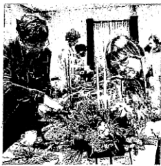
A Kerststukjes maken bij SWOP. ARCHIEFFOTO

om de hoek, maar van lopen komt het niet.”