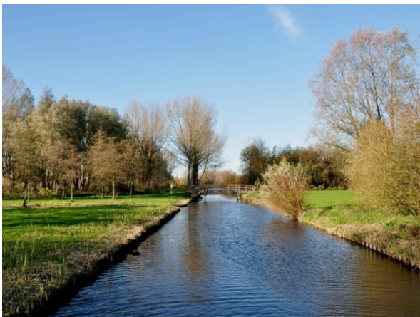
Natuur- en recreatiegebied Vlietland