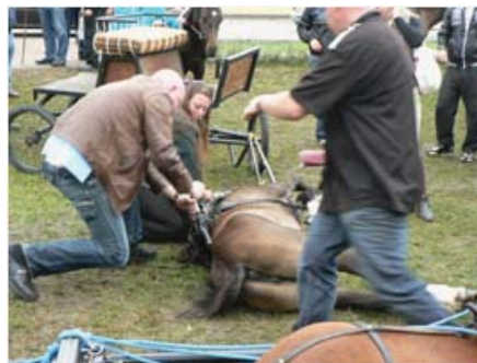
Wantoestanden op Loenense paarden- en ponymarkt

De fractie heeft verder een amendement ingediend op de subsidieverordening. Dit om het mogelijk te maken dat ook projecten rondom dieren, natuur en duurzaamheid in aanmerking voor een subsidie kunnen komen. Deze motie is aangenomen.