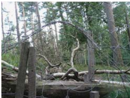
Gaten in hekken, door mensen gemaakt