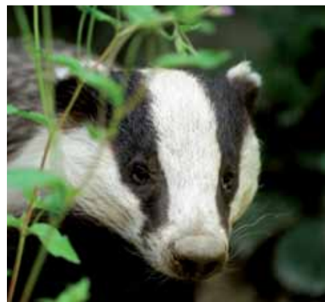
Dassen en hun burchten worden niet langer beschermd

Er dreigt zich een natuurramp te voltrekken in Nederland. Staatssecretaris Bleker (CDA) kapt - met zijn nieuwe Natuurwet in de hand - 70% van het budget van Staatsbosbeheer, schrapt de aanleg van de Ecologische Hoofdstructuur en Ecologische verbindingzones, wil dieren weer laten doodschieten door hobbyjagers. Hij doet er alles aan om onze prachtige natuur weg te zetten als niet het beschermen waard, als overbodig.