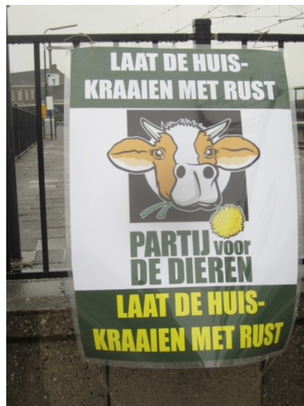
Protestactie tegen doden huiskraai Hoek van Holland