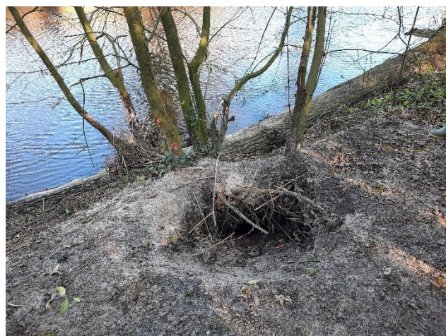
We zagen een dassenhol tijdens een excursie naar de Wambergese beek

https://bsky.app/profile/pvddaaenmaas.bsky.social