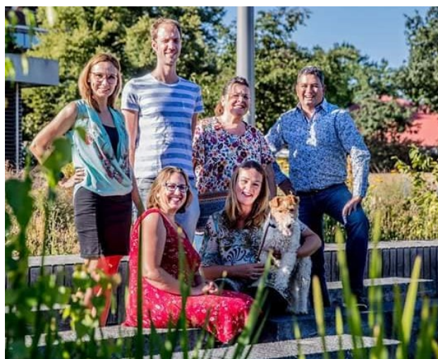
Deze foto is drie jaar geleden genomen

De fractie vergadert op maandagavond. Geïnteresseerde leden zijn van harte welkom om een keer langs te komen. Op donderdagavond is de politieke markt of de raadsvergadering.