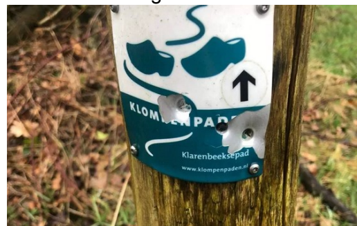
▲ Kogelgaten in een bord van het Klarenbeeksepad.

Daarnaast hebben we expertmeetings over droogte en natuur en klimaat geïnitieerd.