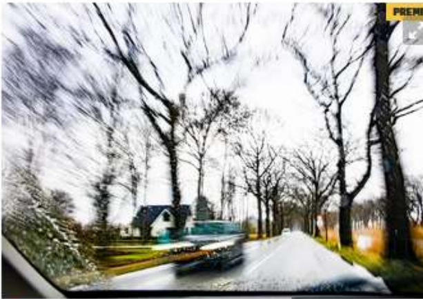
▲ De weg langs het kanaal is smal en heeft aan weerszijden flinke bomen. Regelmatig gebeuren er ongelukken, met vaak ernstige gewonden.

De Apeldoornse fractie van de Partij voor de Dieren is regelmatig in het nieuws, vooral in de regionale krant de Stentor, in de lokale kranten het Stadsblad, de Regiobode, Stedendriehoek, ApeldoornDirect en bij de lokale omroepen RTV Apeldoorn en SAMEN1 en Omroep Gelderland. Hieronder wat voorbeelden.