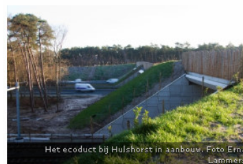
Het ecoduct bij Hulshorst in aanbouw.

08 november 2012 | Laatste update: 13 november, 11:20