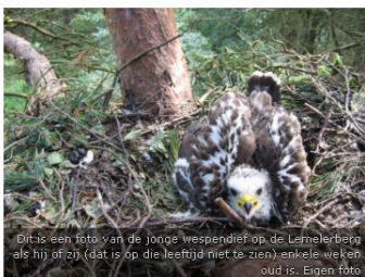
Dit is een foto van de jonge wespendif op de Lemelerberg als hij of zij (dat is op die leeftijd niet te zien) enkele weken oud is.

NUNSPHEET - Bruiloftsgasten willen op 26 april vuurwerk afsteken vanaf een parkeerplaats aan het Vennenpad in Nunspeet.