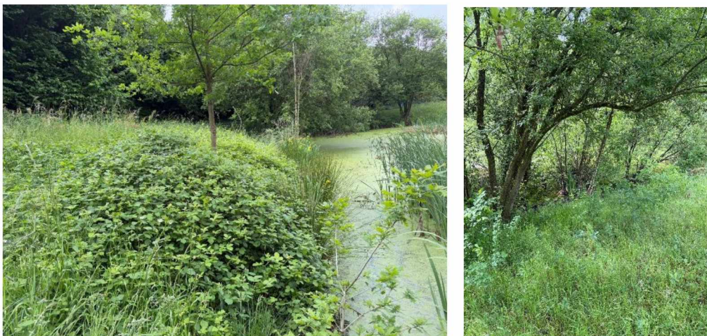
Figuur 2: Impressie foto's vijver

Tijdens werkzaamheden dient rekening te houden om amfibieën en vissen die mogelijk in het water zitten de kans te geven om te vluchten. Hiervoor dient tijdens de werkzaamheden één kant op gewerkt te worden.