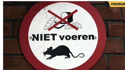
▲ Bord in Amsterdam.