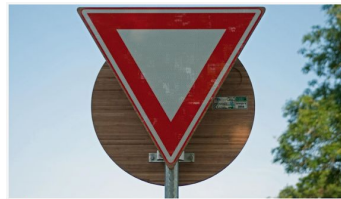
▲ Een verkeersbord van bamboe gaat tegen mee en verduurzaming van de afvalmarkt aanpakken van de Partij voor de Dieren, foto