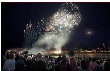
▲ Vuurwerk aan het begin van de Vierdaagse Vierdaagse.