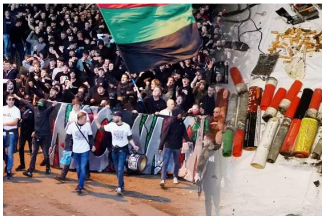
▲ Het NEC-legioen trok voorafgaand aan de wedstrijd tegen Excelsior met fakkels door Nijmegen.

Mitchel Suijkerbuijk 17-11-22, 10:02 Laatste update: 17-11-22, 10:40