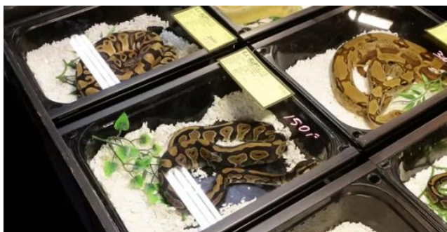
▲ Een reptielenbeurs met dieren die te koop waren in Gorinchem.