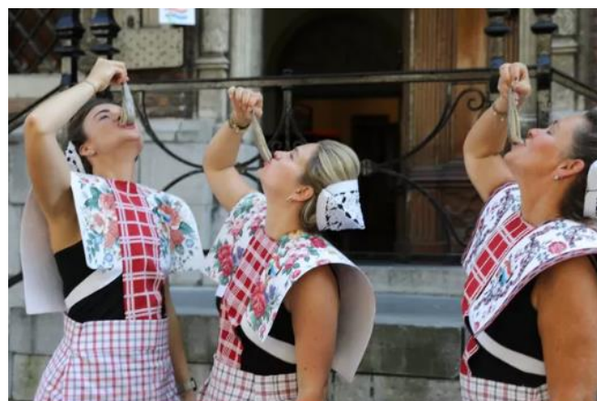
▲ De Nijmeegse Haringparty.