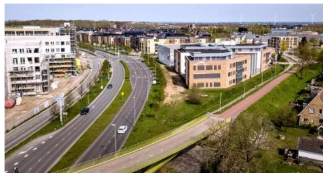
▲ Het Citadel College, een school die na 2008 nog naast een te drukke weg is gebouwd.