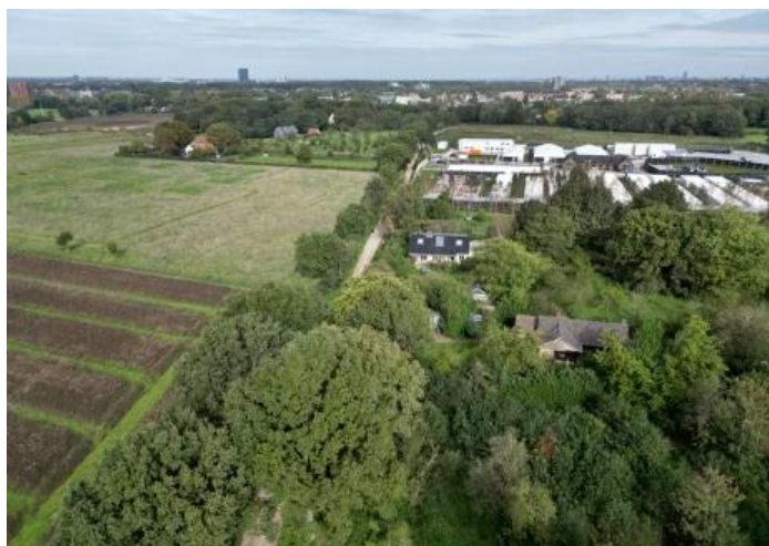
▲ De noodopvang in het groene gebied tussen Malden en Nijmegen.