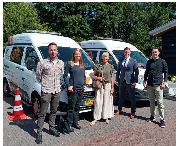
Werkbezoek fractie aan dierenambulance Den Haag

De gemeenteraad in Pijnacker-Nootdorp hanteert het BOB-model, bestaande uit drie opeenvolgende vergaderfasen: Beeldvorming, Oordeelsvorming, en Besluitvorming. In de Beeldvormende fase worden technische vragen gesteld zonder oordeel. In de Oordeelsvormende fase geven fracties hun oordeel en wordt er gedebatteerd, inclusief politieke vragen aan het college. In de Besluitvormende fase worden moties en amendementen besproken en besluiten genomen over de agenda-onderwerpen.