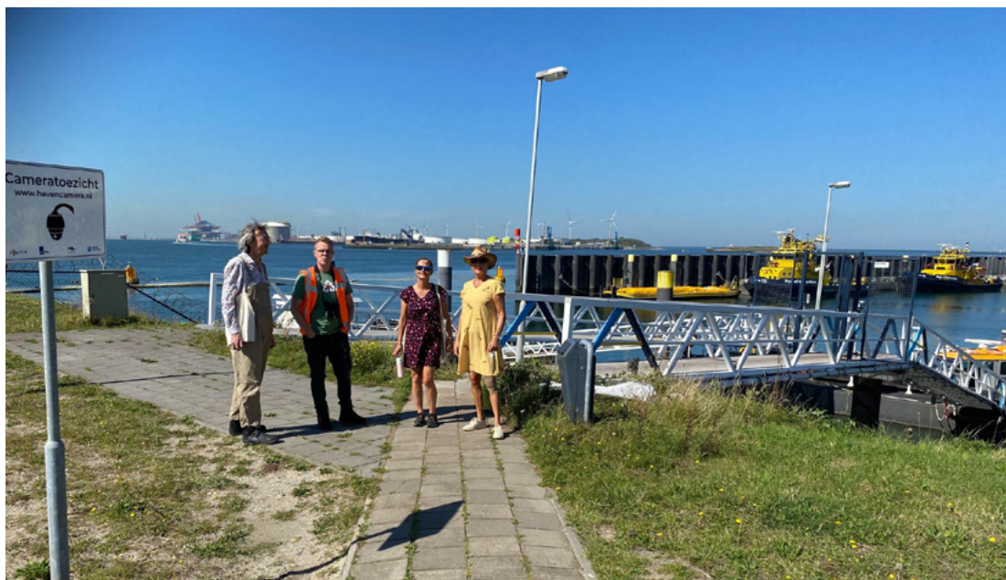
Werkbezoek Rotterdamse Haven, september 2023

nacht te kunnen doden en geven de vos de schuld van de teruggang van de meeuwenstand. Daarnaast heeft het Havenbedrijf doelstellingen geformuleerd om de biodiversiteit de ruimte te geven in het havengebied. De vos is een cruciale schakel in het ecosysteem. Een belangrijk onderdeel van het voedsel bestaat uit konijn. De afgelopen jaren zijn in het havengebied ook vele duizenden konijnen afgeschoten. Dit is de wereld op zijn kop. Het natuurlijk evenwicht in het havengebied moet worden hersteld om de biodiversiteit de ruimte te geven. De Partij voor de Dieren vindt dat het Havenbedrijf zelf maatregelen moet treffen om de meeuwenkolonies weer ruimte te geven in het gebied, ook al gaat dit ten koste van verdere economische ontwikkeling. Zie hier de Schriftelijke vragen bestrijding vos in Havengebied Rotterdam .